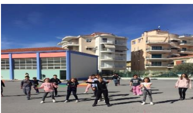
Μανωλοπούλου Κλέρη - Ρούνη Κων/να Ε' Τάξη