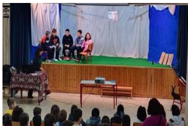
Τσένε Ρουμπίν Ε' Τάξη

καλύτερο εαυτό τους και χειροκροτηθήκαμε από όλους!!!!