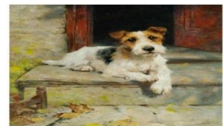
Σιαβελής Παναγιώτης Ε Τάξη