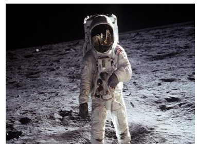
Πετρόπουλος Ηλίας Ε' Τάξη

Ο Άρμστρονγκ πάτησε πάνω στην επιφάνεια της Σελήνης και περιέγραψε το γεγονός ως " ένα μικρό βήμα για τον άνθρωπο, ένα τεράστιο άλμα για την ανθρωπότητα " ("one small step for [a] man, one giant leap for mankind"). Το Απόλλων 11 τερμάτισε ουσιαστικά την κούρσα των δύο υπερδυνάμεων για την κατάκτηση του Διαστήματος και εκπλήρωσε έναν εθνικό στόχο που είχε τεθεί το 1961 από τον Αμερικανό πρόεδρο Τζον Φιτζέραλντ Κένεντι.