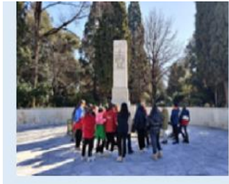
Φράγκος, Νεργκιόνι, Σιάλαρης Στ' Τάξη

Την Τρίτη 14 Φεβρουαρίου η Στ' τάξη πραγματοποίησε εκπαιδευτικό πρόγραμμα « Από την προεπαναστατική Τριπολιτσά και την άλωση στην Βαυαροκρατία » σε συνεργασία με τη Δημοτική Βιβλιοθήκη της Τρίπολης. Σκοπός ήταν να γνωρίσουμε καλύτερα τους ήρωες του '21 εξερευνώντας τοπωνύμια και οδωνύμια της πόλης μας. Λίγες μέρες νωρίτερα και στις ώρες των Εργαστηρίων Δεξιοτήτων (παγκόσμια-τοπική-πολιτιστική κληρονομιά) αξιοποιήσαμε πληροφορίες από το βιβλίο της Ιστορίας , συλλέξαμε αντικείμενα που σχετίζονται με την Ελληνική Επανάσταση (παλιά χαρτονομίσματα, παιχνίδια επιτραπέζια, σουβενίρ και βιβλία) και κατασκευάσαμε μια μακέτα , στην οποία χαραχθηκαν οδοί, πλατείες και μνημεία που είναι αφιερωμένα σε σπουδαίες προσωπικότητες του '21. Η ημέρα ξεκίνησε με πρώτο σταθμό την εκκλησία της Μεταμόρφωσης και τον αδριάντα του Μανώλη Δούνια , του πρωτοπορητή της πολιορκίας της Τρίπολης. Έπειτα, ακολουθώντας την οδό Δούνια, καταλήξαμε στην πλατεία του Άρεως και συγκεκριμένα στο μνημείο αρχιερέων και προκρίτων και στις προτομές των αγωνιστών . Ο επόμενος σταθμός ήταν ο αδριάντας του Θεόδωρου Κολοκοτρώνη και των Τερτσέτη και του Πολυζωΐδη στο δικαστήριο . Στο τέλος, επισκεφτήκαμε το Πολεμικό Μουσείο της Τρίπολης, όπου θαυμάσαμε πρωτογενείς πηγές, όπως όπλα των ντόπιων μας αγωνιστών.