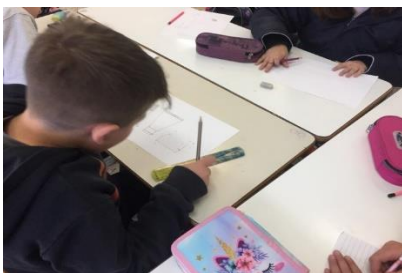
Ρούνη Κω/να –Μετελλάρι Ιωάννα Ε΄ Τάξη