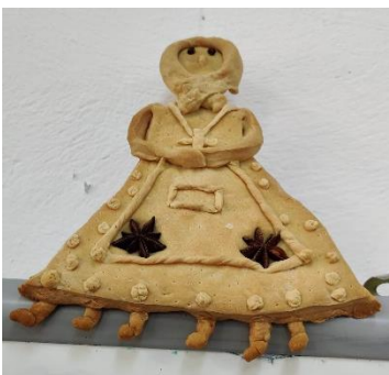
Ε.Δρακοπούλου ΣΤ' Τάξη

Την κυρά Σαρακοστή που είναι έθιμο παλιό οι γιαγιάδες την έφτιαχναν με αλεύρι και νερό. Για στολίδι της φορούσαν στο κεφάλι ένα σταυρό μα το στόμα της ξεχνούσαν γιατί νήστευε καιρό. Και τις μέρες της μετρούσαν Με τα πόδια της τα επτά. Κόβαν ένα τη βδομάδα Μέχρι να 'ρθει η Πασχαλιά.