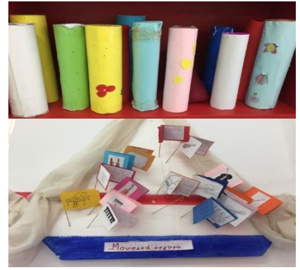
Μαρία Παναγιωτακοπούλου, Πέτρος Πετρόπουλος, Γιώργος Κολιαλής Ε' Τάξη

Μπορείς, αν θέλεις, να κολλήσεις χαρτόνι γύρω από το ρολό και να ζωγραφίσεις σχέδια πάνω σε αυτό.